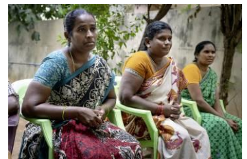
Keine Fragen offen Ob zu Mitgliedsbeitrag, Stipendien oder Kredit - bei der Sitzung der Kooperative in Guntur werden alle Zweifel beseitigt.